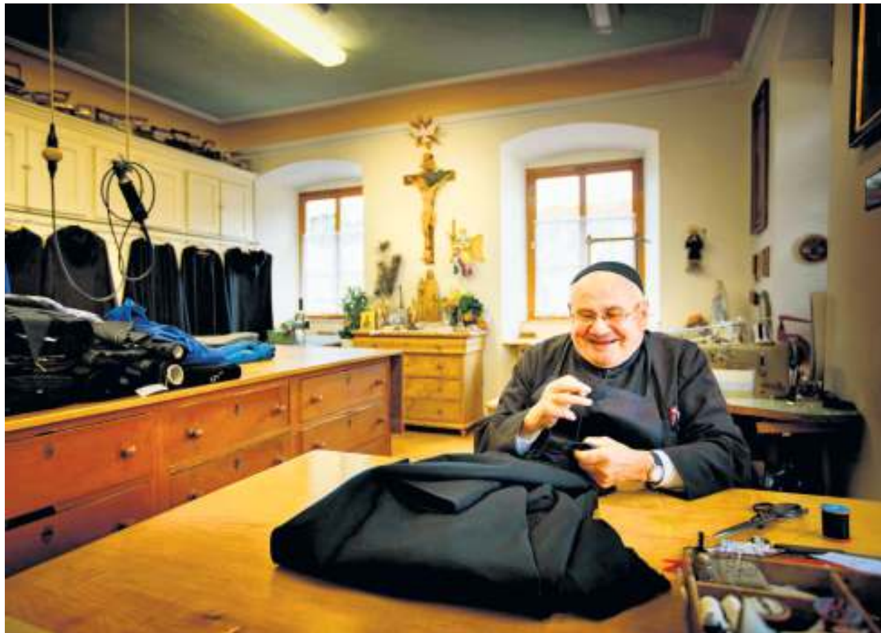
In der klostereigenen Schneiderei