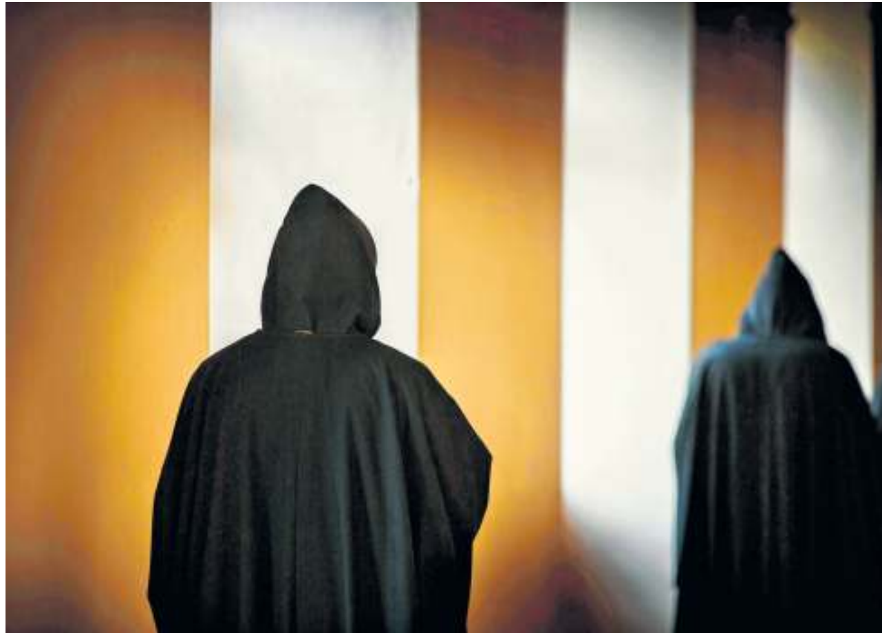
Auf dem Weg zum Abendgebet

Einkehr (I) Um als Mönch leben zu können, muss man sich in einer anderen Welt zu Hause fühlen. Ein Besuch im Benediktinerkloster Beuron. Von Robin Szuttor