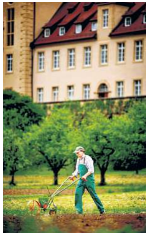
Ein Mönch bei der Gartenarbeit